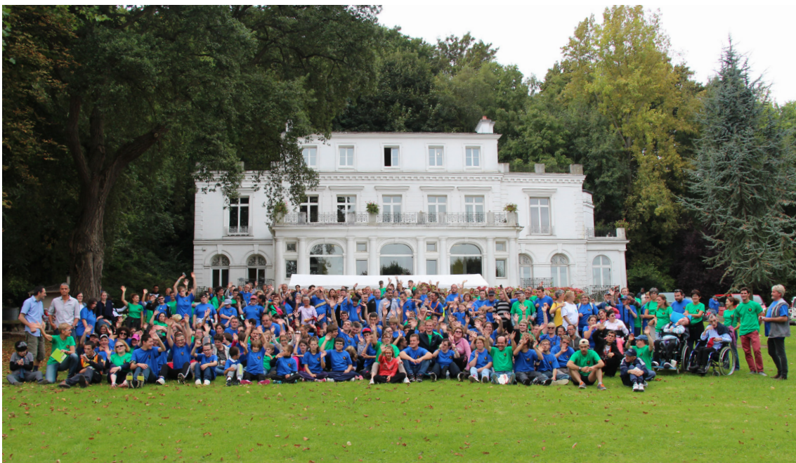
Photo de groupe à l'IME suite à la marche entre les établissements le 27 septembre 2016, à l'occasion des 50 ans de l'APEI de la Région Dieppoise

Pour révéler sa créativité, chacun doit se sentir en confiance et libre mais aussi en capacité de reconnaître ses limites, d'où l'importance de pouvoir s'appuyer sur une réflexion collective. Cette démarche associative favorise l'inclusion et le développement personnel des richesses humaines, et participe à changer le regard de la société sur le handicap.